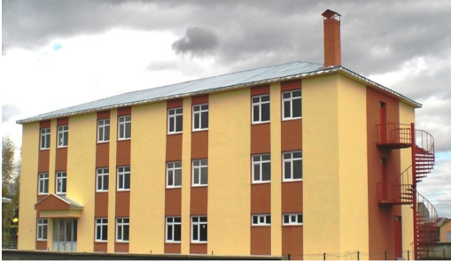
ŞEHİT TEĞMEN GÖKHAN YAŞARTÜRK ÇOK PROGRAMLI LİSESİ KIZ ÖĞRENCİ YURDU