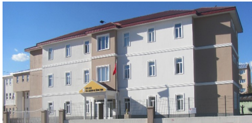
SELİM ANADOLU LİSESİ CELAL KAHRAMAN KIZ ÖĞRENCİ YURDU