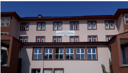
ANADOLU İMAM HATİP LİSESİ ERKEK ÖĞRENCİ YURDU