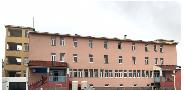
KAZIM KARABEKİR YATILI BÖLGE ORTAOKULU ÖĞRENCİ YURDU