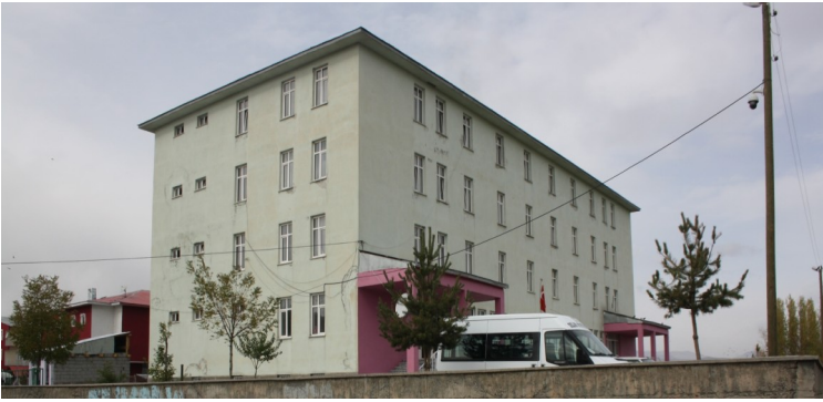
ATATÜRK YATILI BÖLGE ORTAOKULU ÖĞRENCİ YURDU